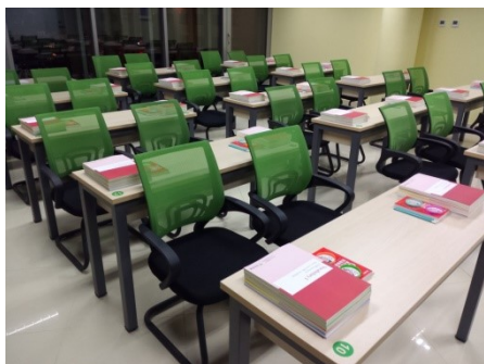
高质量的课程体验