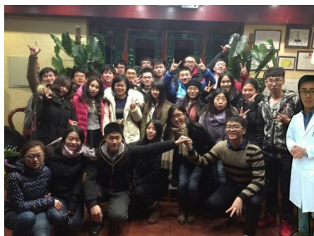
钢铁般的同学友谊