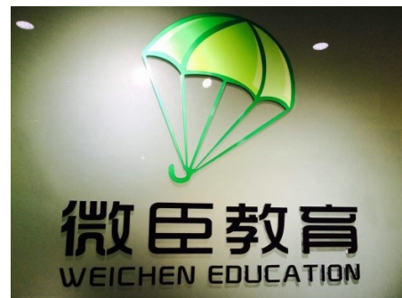
摆脱拖延症的良方